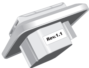
Fig. 2 Rev. 1.1