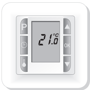
Fig. 1 Startup view